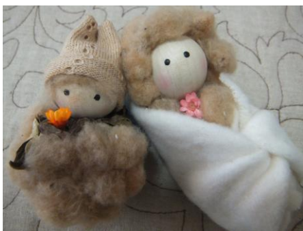
キャップちゃん と ねんねちゃん 1体 840 円